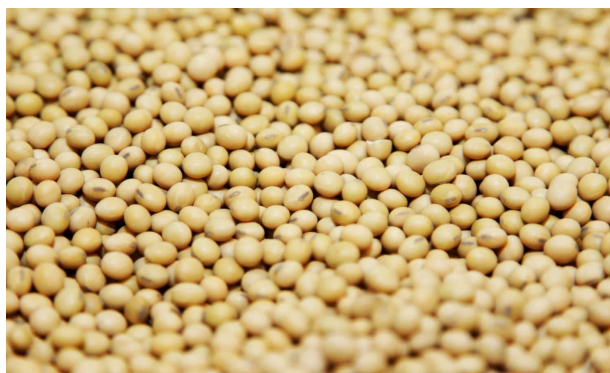
A Monsanto Creve Coeur-i kutatóintézetében (Missouri, USA) egy kosár szójabab van közszemlére téve

Manapság zajló nemzeti vitáinkban számos tudományellenes állítás szerepel, de ezek közül egy sem annyira felháborító, mint a modern mezőgazdasági technológia elleni kampány. Ez közelebbről a genetikailag módosított élőlények (GMO-k) létrehozására szolgáló molekuláris módszerek használata ellen irányul. Itt nincsenek egymással hiteles ellentmondásban álló vizsgálatok, nem vitatkoznak számítógépes modellek érvényességéről, nem történik valamely ökoszisztéma rombolása, nem sérül az emberi egészség, még csak emésztési problémák sincsenek azt követően, hogy összességében eddig 2 milliárd hektáron termesztettek GM növényeket, és több billió adag GM-tartalmú étel is elfogyott. Ennek ellenére ez az összehangolt, bőségesen finanszírozott, fáradhatatlan és alaptalan kampány sok amerikai és európai vett rá arra, hogy kerülje a GM termékeket, és fizessen magas árat azokért a „nem-GM” élelmiszerekért, amelyek egyes esetekben kevésbé biztonságosak és kisebb tápértékűek. Hálát kell adni az égnek, hogy a múltban a